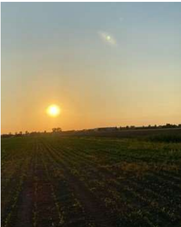
Zon en maan tegelijk te zien maandag 23 juni na de repetitie van de cantonij