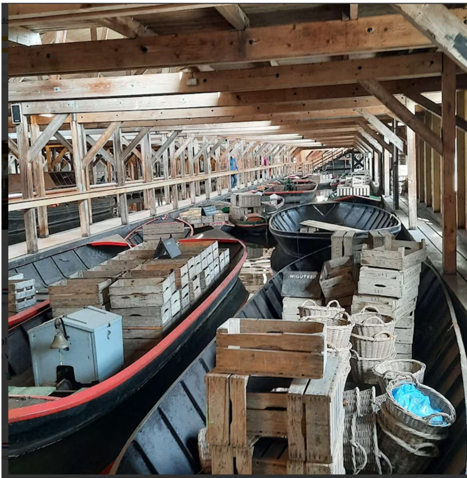
Groenteveiling Broek op Langedijk